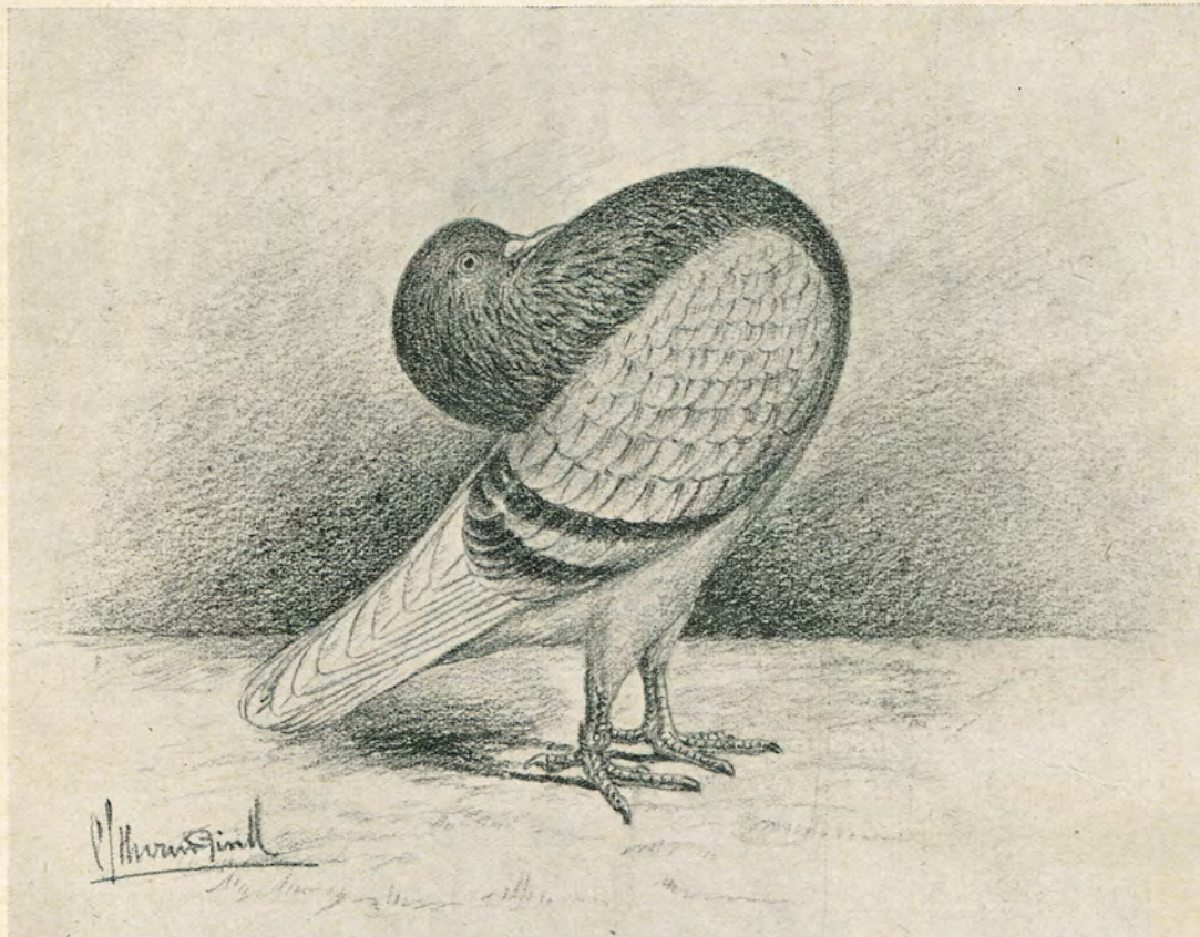
IDEALE ROODBLEEKE GRONINGER SLENKEDUIF