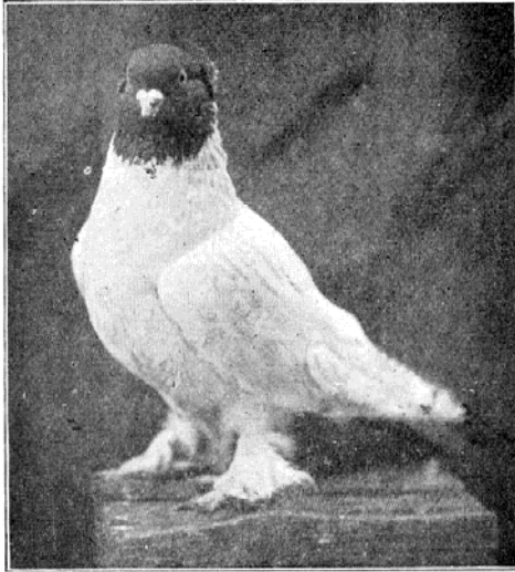
KONINGSBERGER KLEURKOP T U I M E L A A R.

Hongarije bevat nog een aantal daar buiten vrijwel onbekende Tuimelaar- en Hoogvliegersoorten.