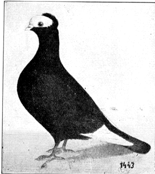
P O O L S C H E K R O O N T U I M E L A A R.

zijn zeer interessante duiven, welke echter meer bij vrijen uitvlucht dan in de volière of in de tentoonstellingskooi tot haar recht komen. Figuur en houding zijn de voornaamste kenmerken. Zonder goede figuur en houding geen