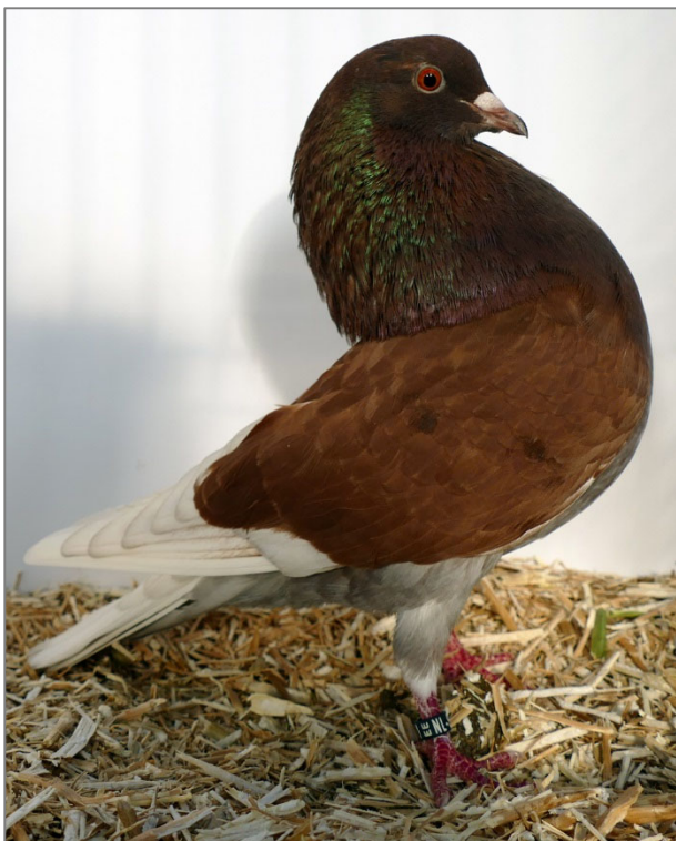
Gelderse slenk (duivin)

Hoewel we in het afgelopen decennium veel hebben bereikt, zien we nog steeds onvoldoende kwaliteit in de volle breedte. Daarom wil ik enkele aandachtspunten noemen om het ras op een hoger peil te brengen.