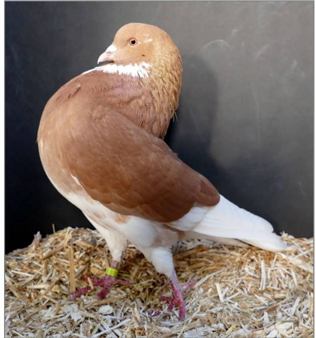
Gelderse slenk (doffer)

worden gedragen. Beide punten zijn noodzakelijk om van een soepele hals te kunnen spreken die nodig is voor een opgerichte hals en het zogenaamde springen tijdens de vlucht. Dieren met soepele en slanke halzen laten ook eerder een lichte sidderhals zien, het zogenaamde grollen. Het liefst zie ik de snavel vrij van de hals. Op de tekening van J. de Jong is de hals nog wat te fors en te stijf, waardoor de lichte S-vorm nagenoeg ontbreekt.