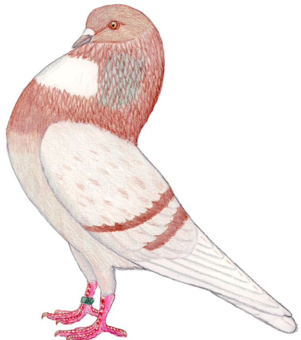
Gelderse slenk in roodbleek; kleurtekening van J. de Jong (2009)

Met de Gelderse slenk wordt ca. 10 jaar gericht gefokt op basis van historische raskenmerken, zoals verwoord in de standaard en de toelichtingen hierop. Tot een 3-tal