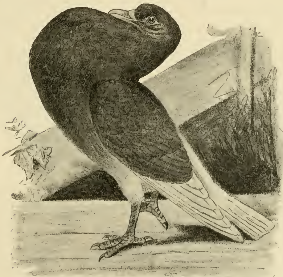
Fig. 147. Die Slenken-Taube.

Wenn wir diese, sowie den darauf zu beschreibenden Ringschläger den langschnäbligen Tümmlern an letzter Stelle beigefellen, so geschieht dies nur, weil beide Rassen sich durch besondere Flugkünste auszeichnen und daher eher zu den „Tümmlern oder Flugtauben“ als zu einer