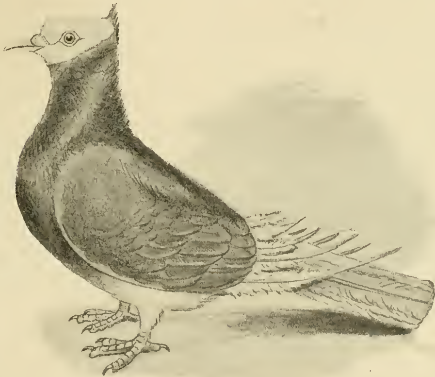
Fig. 148. Ringschläger.

und rot (ihrem Werte nach geordnet) vorkommt, heben sich in weißer Farbe der Kopf, Schwanz, Bürzel, Unterleib bis zu den Schenkeln, die Schenkel selbst und die ersten sechs Schwungfedern ab. Oftmals erstreckt sich aber die Grundfarbe bis zum Bürzel und Schwanz, bei den Schwarzen auch über den Schwanz. Ferner gibt es auch einfarbige mit weißem Schwanz, besonders lichtblaue mit und ohne Flügelbinden. Alle diese Zeichnungen entsprechen aber nicht dem Standard. Die weiße Zeichnung des Kopfes soll sich von der Kehle in einem Bogen, der „zwei Strohhalmte breit unter den Augen“ verläuft, bis zur Innenseite der Spitzhaube erstrecken und letztere mit umfassen. Es ist hauptsächlich auf