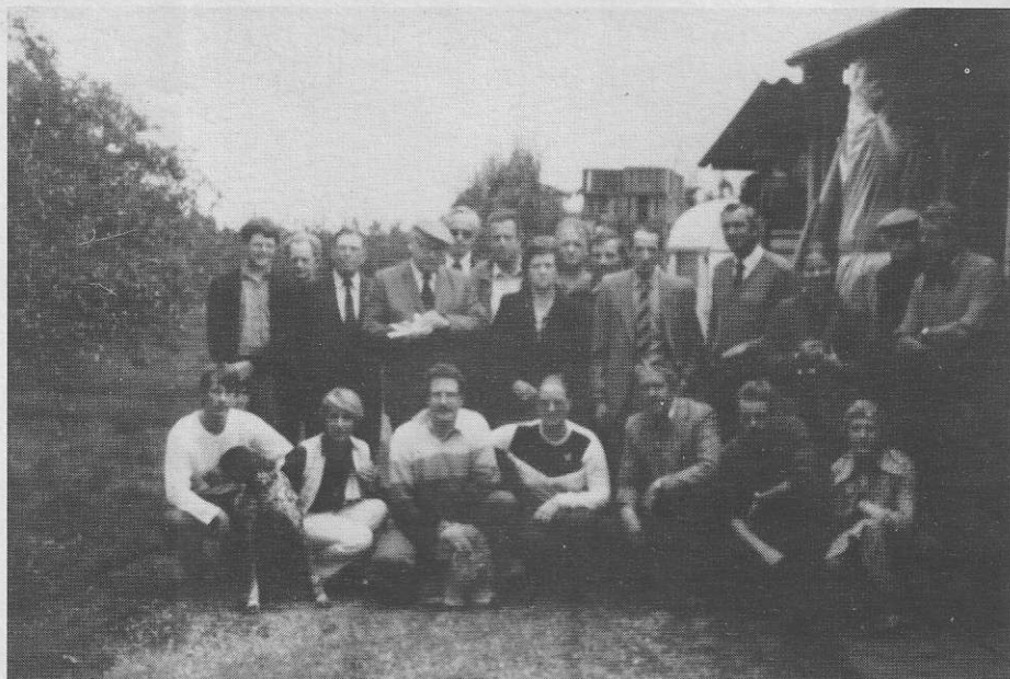
De aanwezigen op de te Lent gehouden Slenkendag