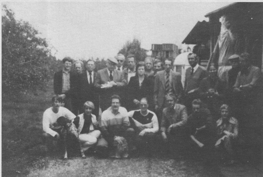
De aanwezigen op de te Lent gehouden Slenkendag