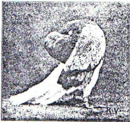
Roodbleeke duif; goed van model en teekening.

Zooals nu nog steeds waren we toen reeds tegenstanders van groote duiven. Ze behoorden kort te zijn, goed te „hangen” en niet eeuwigdurend op hun staart te rijden. Ze mochten geen krop hebben. Dikwijls kregen we dieren te zien, die blazen en dat fok je er moeilijk uit. Een goede