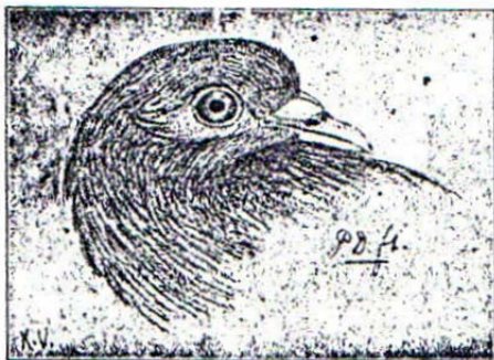
Ideale Slenkekop. Deze teekening laat zeer duidelijk het typische van de Slenkekop en het mooie oog zien.

Zoals het meestal gaat, de fok viel mee en we ruilden een paar jongen voor een ander stel, maar dat was misère. Waar twee ruilen moet een huilen, en gehuild hebben we niet, maar we hadden spoedig begrepen (zooveel kennis geeft liefhebberij) dat we ons „verruild“ hadden. We zochten onze slenkē op, lieten de nieuwelingen zien en nu kregen we zeer