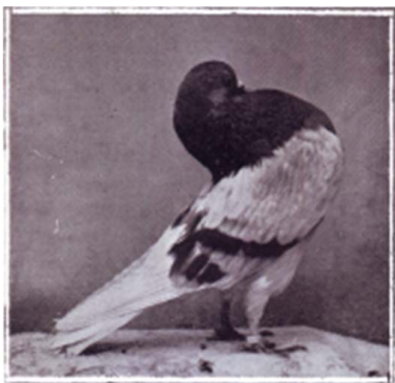
Voorbeeld van een eenvoudigere variëteit van de moderne Groninger slenk. Afbeelding van H. Logman jr. (ca. 1941)

De Gelderse slenk vormt meer het oudere slenkentype van omstreeks 1900, een eenvoudigere variëteit van de moderne Groninger slenk. Volgens Spruijt (1935) kwam deze variëteit steeds terug bij het fokken van Groninger slenken. Dit valt goed te verklaren, omdat zeker al vanaf de eerste standaard van de Groninger slenk in 1922 een moderner type werd verlangd. Vanaf die tijd werd een slechte Groninger door Groninger slenkenfokkers voor Gelderse uitgescholden (Sanders, ca. 1930).