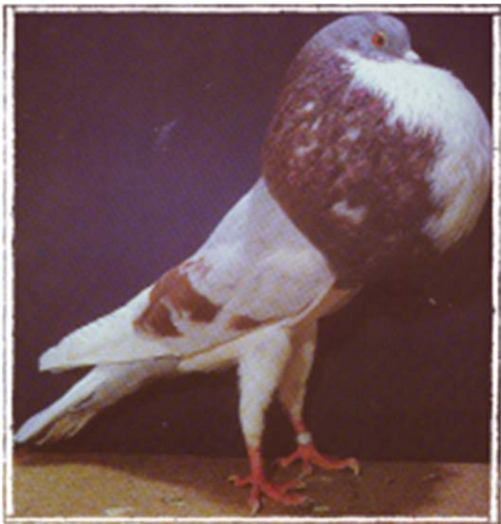
Norwich kropper, afbeelding van W.M. Levi (1965)

Het begrip trek-en-drijf werd vooral in Arnhem e.o. gebezigd. Thans is het een vrij algemeen begrip in de vliegduivensport. Het verwijst naar een specifieke vliegstyl. Met trekken (ook wel zwemmen genoemd) wordt het zich met krachtige vleugelslagen (schokkend) vooruitwerpen op ongeveer dezelfde hoogte bedoeld. Het drijven (ook wel zeilen genoemd) verwijst naar het met opgeheven vleugels (langzaam dalend) vooruitvaren. Bij deze trek-en-drijfvlucht worden de vleugels boven en onder krachtig, luid klepperend, tegen elkaar geslagen en heeft de staart een holle waaivorm.